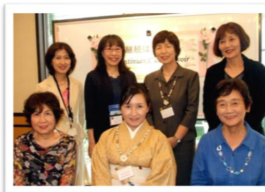
28期役員です。 よろしくお願ひ申し上げます。

本日はITC千里クラブのクリスマス例会にお越しくださいましてありがとうございます。